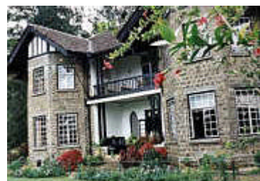
Norbert Schnorbach Greystone-Villa in Diyatalawa

Und wer sehen möchte, wie Sandelholz, Knoblauch, Nelken und Hunderte von Kräutern und Heilpflanzen zu Medikamenten verarbeitet werden, darf sich in der Arzneimittelfirma umschaun. Dort köchelt Öl in großen Bottichen. In einem Dutzend großer Teakholz-Fässer reift einen Monat lang ein Likör-ähnliches Kräuterelixier. Das Vorratslager ist eine Duft-Orgie für die Nase. "Wir haben 240 Pflanzenstoffe auf Lager", erzählt Vindyani Hettigoda, die Enkelin des Firmengründers. "Allein für das Rezept des Kräuterweins Dasamularishta, den auch die Gäste im Hotel erhalten, braucht man 84 Pflanzen."